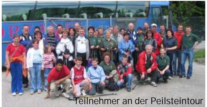
Teilnehmer an der Peilsteintour

Die Wanderung führte uns von Neuwaldhäusl auf der Forststraße bis zur Laabstelle, von dort ging es über die Peilstein Kaiserstrecke hinauf auf das Gipfelkreuz und zu unserem Zielort Altwaldhäusl. Der gemütliche Ausklang fand am Sportplatz Rottenberg statt, wo für unser leibliches Wohl und gute Unterhaltung bestens gesorgt wurde. Die Sektionsleiterin möchte sich bei allen Helfern/Innen für die gute Zusammenarbeit bedanken.