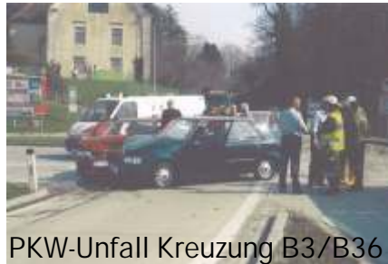
PKW-Unfall Kreuzung B3/B36

Am Ausbildungssektor wurde das erstellte Übungsprogramm für die erste Jahreshälfte durchgeführt. Neben Funk-, Atemschutz- und Schadstoffübungen wurde eine Brandeinsatzübung bei Fam.