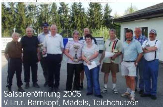
Saisonöffnung 2005 V.l.n.r. Bärnkopf, Mädels, Teichschützen

Am 1. Mai 2005 veranstaltete der USV HOFAMT PRIEL das alljährliche Saisonöffnungsturnier. 9 Hobbymannschaften nahmen an diesem Turnier teil. Eine große Überraschung lieferte dabei die Mannschaft der "MÄDELS" - welche verstärkt mit einem männlichen Schützen - das Turnier für sich entscheiden konnten. Am 2. Platz landeten die Gäste aus Bärnkopf vor den "Teichschützen".