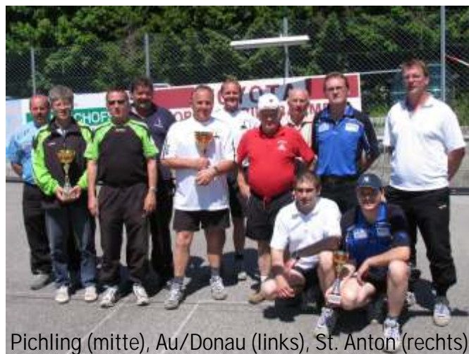
Pichling (mitte), Au/Donau (links), St. Anton (rechts)

Am Samstag setzten sich die beiden Mannschaften aus Oberösterreich durch. Es gewann ESV Pichling vor ASKÖ AU/DONAU und dem ESV St. Anton.