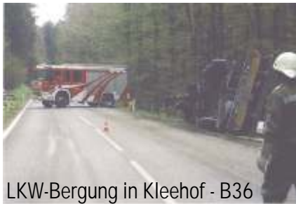
LKW-Bergung in Klee Hof - B36

Das erste Halbjahr 2005 ist bereits beinahe vergangen. Die Freiwillige Feuerwehr Weins Yspersdorf musste in dieser Zeit zu 1 Brandeinsatz und zu 14 technischen Einsätzen ausrücken.